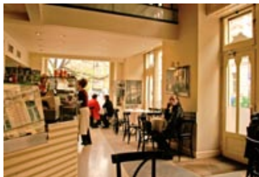
Cafe Dolce Vita

Nachdem wir dann bereichert mit eineigen Programmzetteln der Kirchenkonzerte der nächsten Tage eine nette Bar für unser sehr leckeres Abendessen - leider hatten sie kein Gulasch mit Knödeln - zu uns genommen hatten, war der erste Nachmittag vorbei. Was macht man nun in Prag in zwei Tagen? Am nächsten Tag besuchten wir den Wenzels Platz.