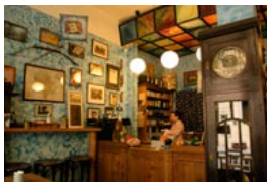
Kaffee Haus, www.ebelcoffee.cz, Rybna Strasse