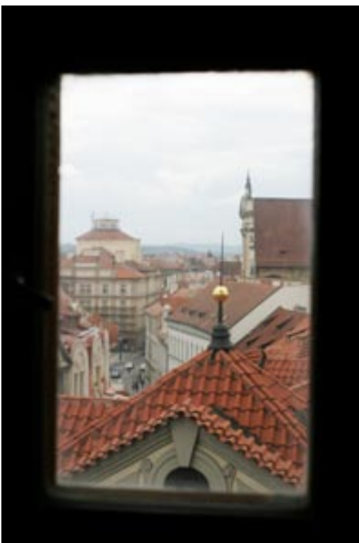
Blick vom Turm bei St.Nikolaus auf der Kleinseite

Im Großen und Ganzen kann ich sagen, dass Prag wirklich durch seinen Flair für mich die goldene Stadt bleiben wird, und immer eine Reise wert ist. Es gibt viel zu viel zu sehen und zu unternehmen. Selbst die Preise für kulinarische Köstlichkeiten sind noch größtenteils erschwinglich, obwohl der Massen Tourismus auch hier schon seine Spuren hinterlässt.