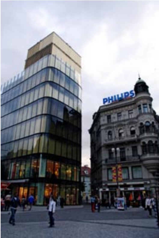
Am Wenzelsplatz geben sich alte und neue Fassaden ein Stelldichein.