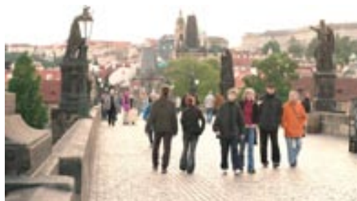
Die Karlsbrücke scheint Zentrum jeglichen Geschehens zu sein

hunderte später aufgestellt wurden. Die Pracht dieser Brücke untermauert im wahrsten Sinne des Wortes das faszinierende Panorama, was sich dem Besucher Prags mit Blick zum höher gelegenen Hradtschin (Burg und Burgviertel) bietet.