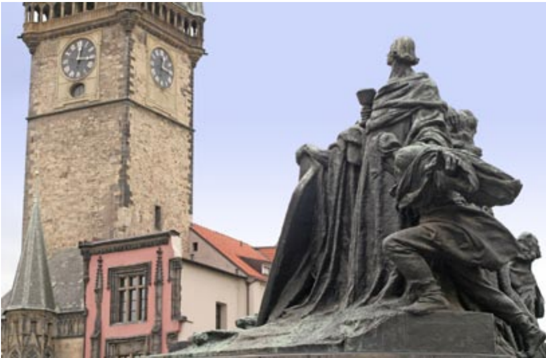
Die Figuren des Denkmals auf dem Altstädter Ring erinnern von der Machart an den Stil Rodins.