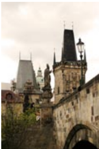
Karlsbrücke mit Blick Richtung Hradtschin

Schon allein, wie sich diese berühmteste Brücke der Stadt, begrenzt von zwei mächtigen Türmen, in 16 Bögen über die Moldau erhebt, ist ein mittelalterliches Meisterwerk. Dieses verbindet über 500 Meter Länge Kleinseite und Altstadt. Die Brücke ist von mehr als 30 steinernen, barocken Heiligenfiguren gesäumt, welche erst einige Jahr-