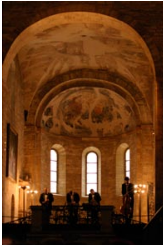
Kirchenkonzert in der St.Georgs Basilika, Prager Burg

Den Nachmittag schlossen wir mit einem wunderschönen Kirchenkonzert in der St. Georgs Basilika, die sich auch noch in der Burganlage befindet, und abends dann mit einem Essen in mittelalter-