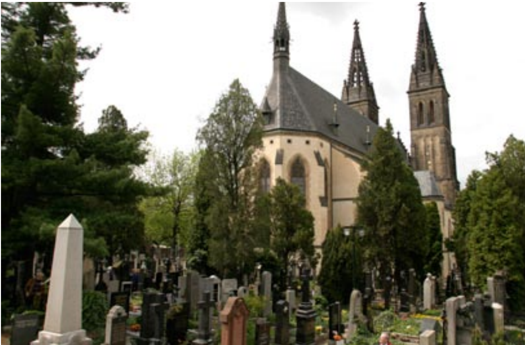
Friedhof auf dem Vysehrad

kompliziert und ist dem eigenen Auto unbedingt vorzuziehen, begeben wir uns ins jüdische Viertel. Die früher große jüdische Gemeinde hat jetzt nur noch 1000 Mitglieder. 80% davon sind älter als 60 Jahre. Fünf Synagogen sind erhalten und zu besichtigen, allerdings sind die Eintrittspreise hier völlig übersteuert. Touristenanlauf ist der jüdische Friedhof: Grabplatten, die übereinander gestapelt sind, da die Gräber bei den Juden nicht aufgelöst werden dürfen. Typisch sind auch bei den jüdischen Grabstätten die persönlichen Beschriftungen der Steine, die größtenteils verwittert sind. Pilgerziel ist das Grab des Rabbi Löw, an dem die Besucher Wunschzettel anbringen. Auch hier war